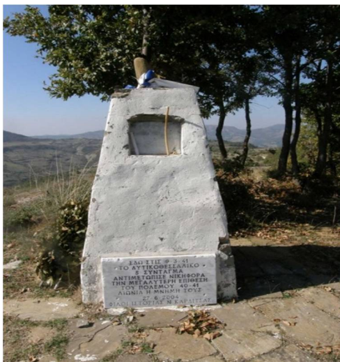
Εικόνα 2 Μνημείο στο ύψωμα 731