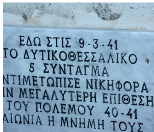
Εικόνα 1 Η μαρμάρινη πινακίδα του μνημείου

Το εν λόγω ύψωμα βρίσκεται περί τα 20χιλ. βόρεια της Κλεισούρας.