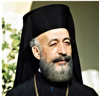
Ο Αρχιεπίσκοπος Κύπρου Μακάριος (1913-1977).

Τον Ιούλιο του 1974, ο Πρόεδρος της Ελληνικής Δημοκρατίας Στρατηγός Φαίδωνας Γκιζίκης[1] και ο Πρωθυπουργός Αδαμάντιος Ανδρουτσόπουλος[2] συμπλήρωναν τον 8 ο μήνα στην εξουσία. Ο Ταξίαρχος Δημήτριος Ιωαννίδης[3], επονομαζόμενος και « άράτος δικτάτορας » διοικούσε τους πάντες, μετά την ανατροπή του Γεώργιου Παπαδόπουλου την 25 η Νοεμβρίου 1973[4]. Ο μεγαλύτερος πονοκέφαλος της ελληνικής κυβερνήσεως αφορούσε την ένταση στις Ελληνοτουρκικές σχέσεις, μετά την ανεύρεση κοιτασμάτων πετρελαίου στη Θάσο. Η Τουρκία ήγειρε αξιώσεις εκμεταλλεύσεως της υφαλοκρηπίδας του Αιγαίου, ενώ διαμήνυσε ότι δεν θα δεχόταν καμία επέκταση των ελληνικών χωρικών υδάτων στα 12 ναυτικά μίλια. « Σαν μη πέρασε μια μέρα από τότε ».