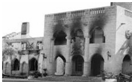
Το Προεδρικό Μέγαρο μετά το πραξικόπημα.