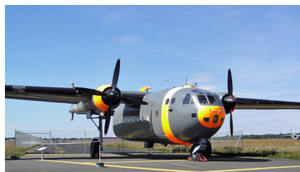
Αεροσκάφος NORATLAS της 354 Μοίρας Μεταφορών.