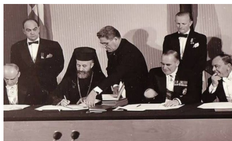
Υπογραφή της Συνθήκης στο Λονδίνο.

[5] Οι συμφωνίες Ζυρίχης-Λονδίνου υπεγράφησαν το 1959 μεταξύ του Ηνωμένου Βασιλείου, της Ελλάδος της Τουρκίας, της Ελληνοκυπριακής και της Τουρκοκυπριακής κοινότητας. Με την υπογραφή τους, τερματίστηκε η βρετανική κυριαρχία και ιδρύθηκε ανεξάρτητο Κυπριακό κράτος. Η συμφωνία της Ζυρίχης υπεγράφη την 11η Φεβρουαρίου 1959, από τους τότε πρωθυπουργούς της Ελλάδος Καραμανλή και της Τουρκίας Μεντερές. Την 19η Φεβρουαρίου, η συνθήκη επικυρώθηκε στο Λονδίνο από την Μεγάλη Βρετανία και τους επικεφαλής των δύο κοινοτήτων. Οι συμφωνίες απέκλειαν τόσο την ένωση, όσο και την διχοτόμηση της Κύπρου. Η συνθήκη προέβλεπε την ίδρυση ανεξάρτητης Κυπριακής Δημοκρατίας προεδρικού τύπου. Η χώρα θα καθίστατο πλήρες μέλος του ΟΗΕ και άλλων διεθνών οργανισμών. Ο πρόεδρος θα ήταν Ελληνοκύπριος και ο αντιπρόεδρος Τουρκοκύπριος με θητείες 5 χρόνων. Το υπουργικό συμβούλιο θα ήταν δεκαμελές [7 Ελληνοκύπριοι(Ε/Κ), 3 Τουρκοκύπριοι (Τ/Κ)]. Η ίδια αναλογία θα ίσχυε και στη βουλή(35 Ε/Κ, 15 Τ/Κ). Η συμφωνία προέβλεπε την παρουσία στο νησί ελληνικής στρατιωτικής δυνάμεως 950 ανδρών (ΕΛ.ΔΥ.Κ) και τουρκικής 650 ανδρών (ΤΟΥΡ. ΔΥ.Κ).