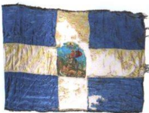
156 Σημαία από την Αντιοχειακή Θρόνη ανεγέρθη από τις Δεσποινίδες των Σπυρίδων Εκκόπριαν. Προσφέρθη στο Μιχαήλιο Σολιώτη, Σουλίου Αλαί, Μιχαήλως Αγίου, μετά την απελευθέρωση της πόλεως το 1870. Δομή: 1,20X 0,55 μ. Αρ. ενδ. 3943.

(...) έφερεν άνωθεν σταυρόν, με γραμμάς κάτωθεν αυτού 16, κατά το σύνθημα της Εταιρείας των Φιλικών, και με την επιγραφήν ή ελευθερία ή θάνατος. Κατόπιν δε ο Ν. Σολιώτης έλαβε προσφερθείσαν αυτώ παρά της μονής Αγίας Λαύρας την χρυσοκέντητων επί των Χριστιανών αυτοκρατόρων σημαίαν της μονής, φέρουσα εξ ενός την Ανάστασιν και ετέρωθεν τον άγιον Γεώργιον. Σώζονται δε ως παρακαταθήκαι μετά τον Αγώνα παρά του Σολιώτου εις τη ρηθείσαν μονήν αμφοτέραι αυταί αι σημαίαι.