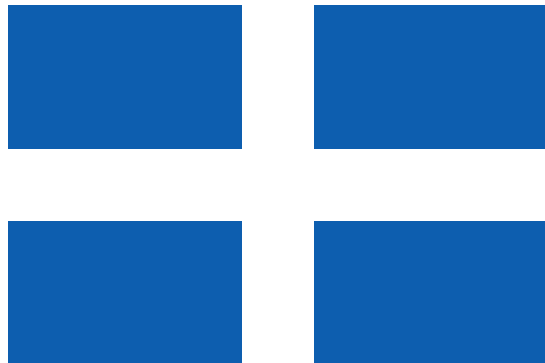
Εικόνα 3 1975 -1978

Στις 18 Αυγούστου του 1970, η αναλογία της σημαίας μετατράπηκε από 2:3 σε 7:12.