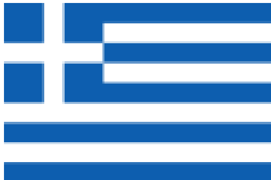
Εικόνα 4 1978 έως σήμερα

Στα πλαίσια του άρθρου 9, καταργήθηκαν οι διατάξεις των προηγούμενων ετών (1967, 1969, 1971, 1973, 1975).