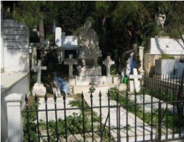
Τάφος του Κολοκοτρώνη στο Α κοιμητήριο Αθηνών