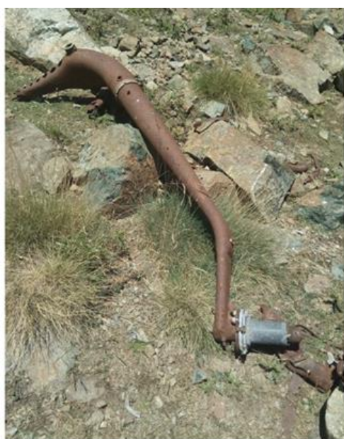
Ένα χαρακτηριστικό εξάρτημα: ο βραχίονας συστήματος προσγειώσεως του Henschel 126, περίπου 80 χρόνια μετά, στον Σμόλικα. Η κάτω φωτογραφία, από το εγχειρίδιο του αεροπλάνου.

Η έρευνα τους τελικώς τους οδήγησε στο συμπέρασμα ότι επρόκειτο για συντρίμια αεροπλάνου και μάλιστα Henschel Hs 126, και εδώ αρχίζει το σημαντικό μέρος της έρευνας τους, ψάχνοντας στο διαδίκτυο βρήκαν ότι μπορεί να επρόκειτο για εξαρτήματα αεροσκάφους Henschel Hs 126 K6 (όπου K6 η εξαγωγική έκδοση του αεροσκάφους αναγνωρίσεων Henschel Hs 126).