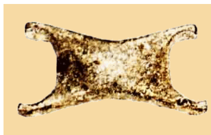
Υπερείδης, Δημοσθένης, Χρυσό Τάλαντο.