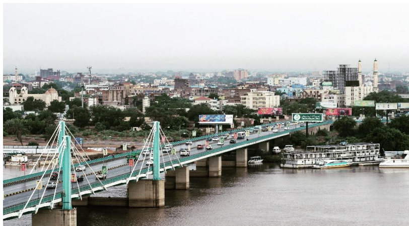
Γέφυρα El Mek Nimr

Ερυθράς Ημισελήνου (Kizilay), για την ανακαίνιση ενός ιατρικού κέντρου για την εκπαίδευση παιδιών με σύνδρομο Down και την κατασκευή του Νοσοκομείου Nyala, σημαντικές συνεισφορές σε ένα έθνος που μαστίζεται από έναν ατελείωτο κύκλο εσωτερικών συγκρούσεων ως αποτέλεσμα της επιδείνωσης των εντάσεων μεταξύ αραβικών και αφρικανικών φυλών.