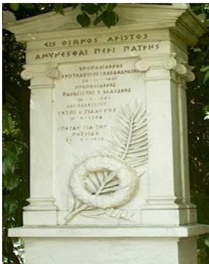
Το μνημείο των τριών πεσόντων στην Πλατεία Ρηγίλλης