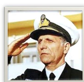
Ναύαρχος Χρ. Λυμπέρης