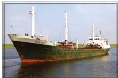
Το Φιγκεν Ακάτ