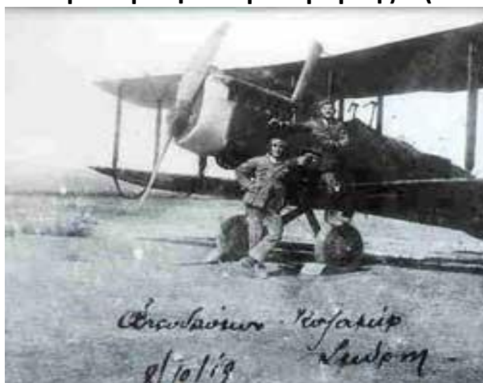
AIRCO DE HAVILLANT D.H.9

Ευθύς μετά την απόβαση του Ελληνικού Στρατού στην Σμύρνη (2/15 Μαΐου 1919), συγκροτείται η « Ναυτική Αεροπορική Μοίρα Σμύρνης» (ΝΑΜΣ), με δύναμη 10 Α/Φ