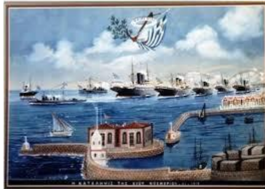
Η απελευθέρωση της Χίου Έργο Αρ. Γλύκας

11η Νοεμβρίου 1912 : Ένας σημαντικός σταθμός στην ιστορία της Χίου αποτελεί η 11η Νοεμβρίου 1912. Η μέρα αυτή αποτελεί το μεταίχμιο της ιστορικής καμπής, όπου η ιστορία της Χίου μπήκε σε νέα φάση με την απελευθέρωση του νησιού από τον δυσβάσταχτο τουρκικό ζυγό. Μια μεγάλη περίοδος κατοχής διακόπτεται.