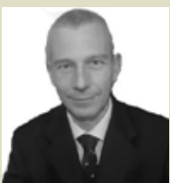
Γράφει ο Αντγος ε.α. Ιπποκράτης Δασκαλάκης Διδάκτορας Διεθνών Σχέσεων στο Πάντειο Πανεπιστήμιο