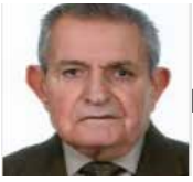
Γράφει ο Υπγος ε.α. Νικόλαος Ζαρκάδας