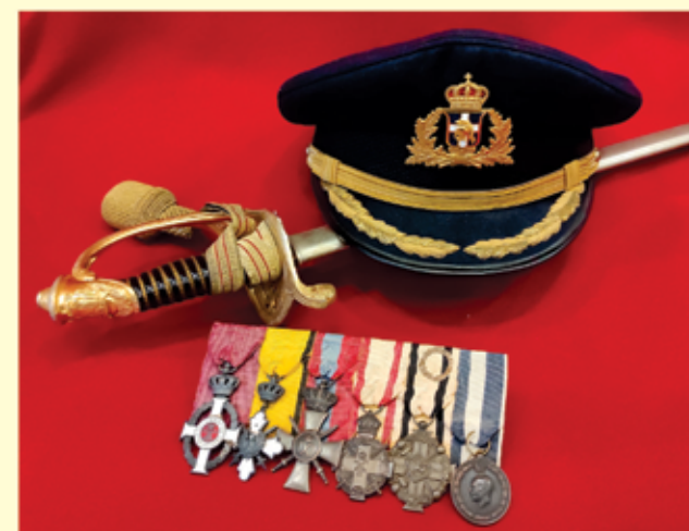
Τα μετάλλια, παράσημα του Υποστρατήγου Γ. Κοντογιάννη μεταξύ των οποίων διακρίνονται Πολεμικοί Σταυροί και Αριστεία Ανδρείας

Οι στολές, το ξίφος, τα μετάλλια, παράσημα καθώς και οι τιμητικές διακρίσεις του Υποστρατήγου Γεωργίου Κοντογιάννη εκτίθενται μόνιμα στο «ΒΛΑΧΟΓΙΑΝΝΕΙΟ ΜΟΥΣΕΙΟ ΜΑΚΕΔΟΝΙΚΟΥ ΑΓΩΝΑ ΚΑΙ ΝΕΟΤΕΡΗΣ ΕΛΛΗΝΙΚΗΣ ΙΣΤΟΡΙΑΣ» (δωρεά της κόρης του Κας Άντας Κοντογιάννη).