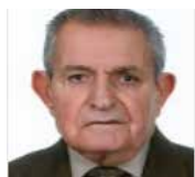
Γράφει ο Υπουργός ε.π. Νικόλαος Ζερκάδης