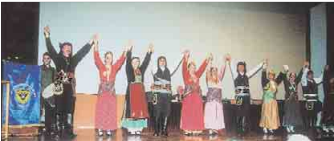
Το Ποντιακό χορευτικό σε μια χαρακτηριστική φιγούρα.