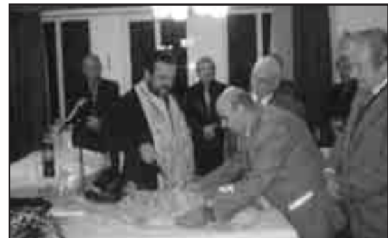
Τετάρτη 23 Ιανουαρίου 2008 από την κοπή της Πρωτοχρονιάτικης πίτας του Παρτος ΕΑΑΣ Μυτιλήνης.