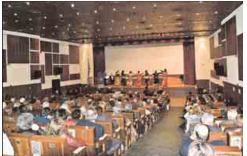
Γενική άποψη του αμφιθεάτρου του Πολεμικού Μουσείου.