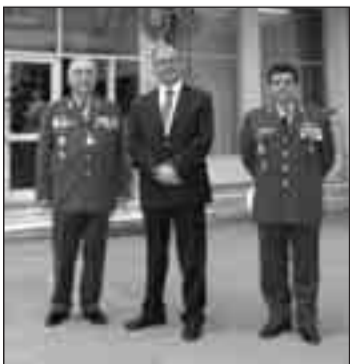
Ο Υφυπουργός Εθ. Αμύνης κ. Τασούλας, ο αρχηγός ΓΕΕΘΑ Στρατηγός Δ. Γράψας, ο αντιστράτηγος Δ. Βούλγαρης ΓΕΣ, ο αντιναύαρχος Ι. Καραμαλίκης και ο αρχηγός ΓΕΑ Αντιπτεράρχος Ι. Γιάκος.

Κάθε χρόνο, η αντιπροσωπεία μας, στην επέτειο της μάχης του Εή Αθαμίν, έχει προορισμό και τον τόπο αυτό.