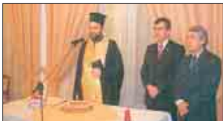
Το ΤΣ Δωδεκανήσου κατά την ευλογία της πίτας.

ΑΔΤΕ, δόθηκε η ευκαιρία να ξανασυναντηθούμε, να ανταλλάξουμε ευχές και να περάσουμε ένα όμορφο βράδυ.