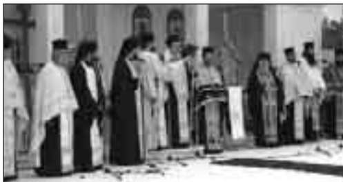
Η αρχιερατική δοξολογία προεξάρχοντος του Σεβασμιωτάτου Μητροπολίτου Χαλκίδας, Ιστιαίας και Βορ. Σποράδων κ. Χρυσοστόμου

μάτης και ο αντιστράτηγος Η. Καζούκας, πρόεδρος ΕΛΕΣΜΕ, αντιπροσωπείες αξιωματικών όλων των βαθμών και Κλητών ΕΔ και ΣΑ, Στρατιωτικοί Ακόλουθοι των εν Αθήναις Ξένων Πρεσβειών, συνάδελφοι του Παραρτήματος Ενώσεως Αποστράτων Χαλκίδας, το παλαιότερο στέλεχος της Σχολής, υποστράτηγος ε.α. Β. Βράκας, μαθητές όλων των βαθμίδων και πρόσκοποι μετά των σημαιών τους καθώς και πλήθος κόσμου.