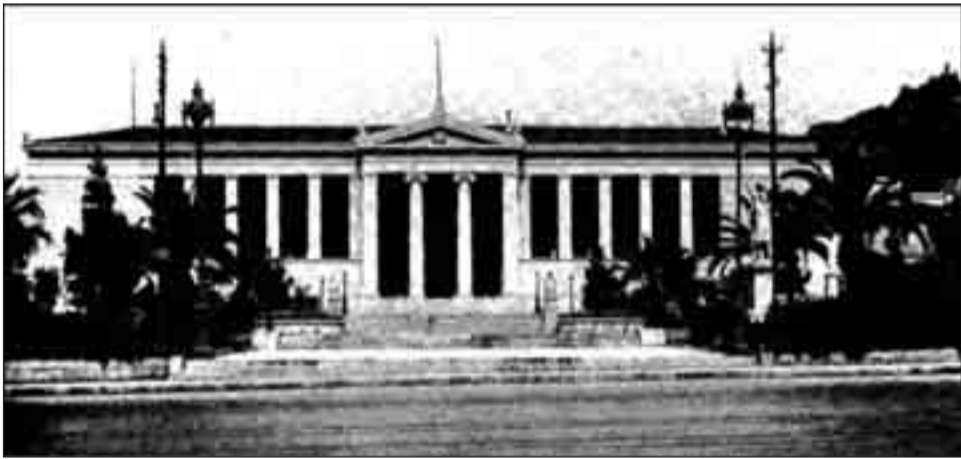
Χριστιανό Χάνσεν, 1839. Το Πανεπιστήμιον των Αθηνών. (Φωτ. 1930).

Το 1836, προκειμένου ανεγερθεί το κτίριο του Παν/μιου ανατέθηκε η σύνταξη του σχεδίου στον Βαυαρό αρχιτέκτονα Λουδοβίκο Λόγγε. Η επίσημη μνεία της ίδρύσεως του Παν/μίου είχε γίνει με το Β.Δ. της 23/3/1833. Η ολοκλήρωση των σχεδίων Λογγέ μεταβλήθηκε διότι η χρηματοδότηση δεν ήτο επαρκής. Όταν εξοικονομήθηκαν χρήμα-