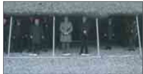
15/1/2009. Ημέρα τιμής αποστράτων.

1. Σας υποβάλλουμε τις παρακάτω εκδηλώσεις-δραστηριότητες που έλαβε μέρος το Παράρτημα Κατερίνης: