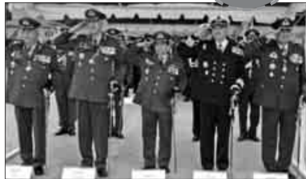
Διακρίνονται ο αρχηγός ΓΕΣ Αντγος Δ. Βούλγαρης, ο αρχηγός ΓΕΕΘΑ Στρατηγός Δ. Γράψας, ο Διοικητής της σχολής Υπτγος Ν. Παναγιωτόπουλος, ο αρχηγός ΓΕΝ Αντιναύαρχος Ι. Καραμαλίκης και ο αρχηγός ΓΕΑ Αντιπτεράρχος Ι. Γιάκος.

Στην Ημερησία Διαταγή, ο Αρχηγός ΓΕΣ παρουσίασε, εν συντομία, το βίο και το μαρτυρικό τέλος, του Αγίου Γεωργίου, αναφέρθηκε στο ρόλο και το έργο του Στρατού Ήνρας, διαχρονικά που οδήγησαν στην απελευθέρωση πατρίων εδαφών και στο διπλάσιο-