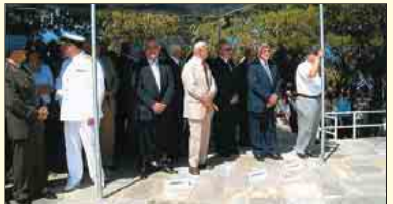
Διακρίνονται οι στρατηγοί κ.κ. Βερυβάκης και Κόρκας, ο πρόεδρος της ΕΑΑΣ κ. Γ. Κοράκης και άλλοι ε.ε. και ε.α. αξιωματικοί.