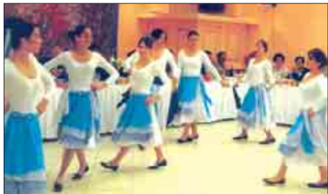
Σύμη 8-5-2009. Επίδειξη παραδοσιακών χορών της Σχολής Ειρήνης Μυλωνάκη.

ραδίδοντας το περίστροφο του Γερμανού στρατηγού Βάγκενερ στον Συνταγματάρχη Τσιγάντε, είπε: