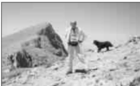
Φωτ. 2 Σκολιό (2.912 μ.) κατά την ανάβαση στις 4 Αυγούστου 2006.

Ο πρώτος εξερευνητής του Ολύμπου, φέρεται να είναι ο σουλτάνος Μεχμέτ ο Δ', ο οποίος ήταν μανιώδης κυνηγός, αλλά η προσπάθειά του να ανέβει το 1669 στην ψηλότερη κορυφή, ήταν ανεπιτυχής. Οι πρώτοι, οι οποίοι έφτασαν στις κορυφές Στεφάνι και Μύτικας (2 Αυγούστου 1913),