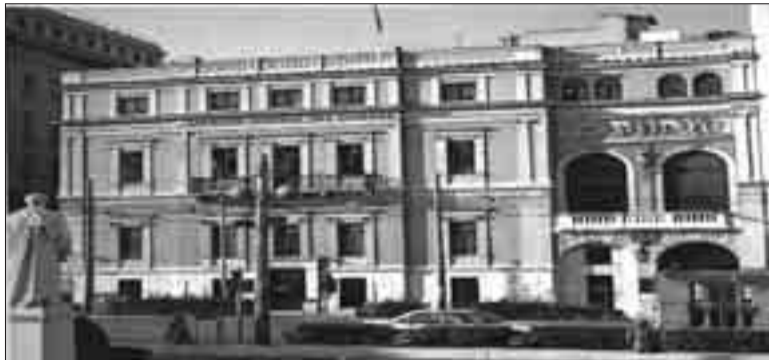
Το κτίριο «Μέγαρο Serpieri» - Σήμερα κεντρικό κατάστημα Αγροτικής Τράπεζας -βρίσκεται στη γωνία των οδών Πανεπιστημίου και Χρ. Λαδά (τ. Εδουρ. Λω).

νει - όπως ανεφέρθη στο προηγούμενο φύλλο της Ε.Η. - σε αντικατάσταση του Λυσ. Καυταντζόγλου, την αποπεράτωση του Πανεπιστημιακού κτιρίου. Εναπομένει σε περαιτέρω έρευνα να ανευρεθούν οι εργασίες του που τον κατέστησαν ικανό για την ανάθεση αυτή. Δεν έλλειπαν διακεκριμένοι Έλληνες και ξένοι που ποχολούντο με μελέτες και κατασκευές Δημοσίων και Ιδιωτικών κτιρίων και όμως επεβλήγει ο Α.Θ.