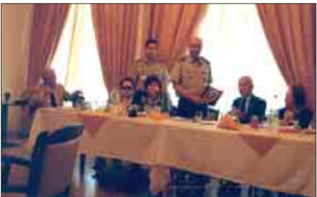
Ρόδος 7-5-2009: Ανταλλαγή πλάκετών μεταξύ Διοικητού 95 ΑΔΤΕ και Λέσχης Καταδρομέων Ιερολοχιτών. Ο Ι. Λόχος Μ.Α. απελευθέρωσε τα Δωδεκάνησα.