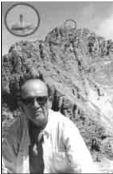
Φωτ. 1 Στη Σκάλα (2.882μ.) με φόντο τον Μύτικα (2.918,8 μ.), κατά την ανάβαση στις 4 Αυγούστου 2006. Ήδη στην κορυφή του Μύτικα διακρίνεται μία μικρή σιλουέτα κάποιου τολμηρού ορειβάτη.

ήσαν οι Ελβετοί φιλέλληνες Daniel Bond - Bonv (Ντανιέλ Μποντ - Μποβί) και Frederic Boissonas (Φρειδερίκος Μπουασσονά) βοηθούμενοι από τον Έλληνα κυνηγό αγριοκάτσικων και γνώστη του Ολύμπου Χρήστο Κάκαλο 2 (ηλικίας τότε 31). Ακολούθησαν και άλλες εξερευνήσεις, τόσο