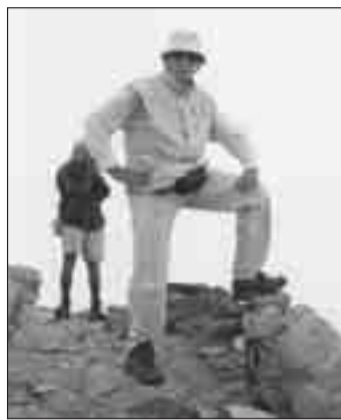
Φωτ. 3 Σκάλα (2.866 μ.), κατά την ανάβαση στις 19 Ιουνίου 2005.

Το πρώτο καταφύγιο, Καταφύγιο Α' ή Σπήλιος Αγαπητός (2.100 μ.) χτίστηκε το 1931 από τον Ορειβατικό Σύνδεσμο Αθηνών. Λειτουργεί από το 1931. Σήμερα ανήκει στην ΕΟΟΑ (Ελληνική Ομοσπονδία Ορειβασίας - Αναρρίχησης). Έχει κτιστεί στη θέση Μπαλκόνι στο Μαυρόλογο (φωτ. 4).