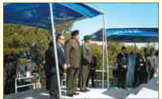
Διακρίνονται ο Υφυπουργός Ανάπτυξης κ. Βλάχος Γ. και ο Γεν. Επιθεωρητής Στρατού κ. Φραγκούλης Φρ.

Σε μια σεμνή τελετή, στο Λόφο της Βουλιαγμένης (Καβούρι), η Διεύθυνση Ειδικών Δυνάμεων ΓΕΣ, τίμησε την 31-5-2009 στον προ του Μνημείου χώρο, τους πεσόντες πολεμιστές του Ιερού Λόχου Μέσης Ανατολής περιόδου 1942-1945 και τους καταδρομείς των περιόδων 1946-1949 και 1964-1974, στον Ελληναϊκό και Κυπριακό χώρο αντίστοιχα.