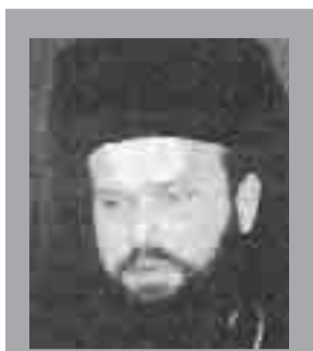
ΤΟΥ ΑΡΧΙΜΑΝΔΡΙΤΟΥ ΕΠΙΦΑΝΙΟΥ ΟΙΚΟΝΟΜΟΥ Διευθυντή Ρ/Φ Σταθμού Εκκλησίας Ελλάδος

Ως αιτίες εξάπλωσης της οικογενειακής βίας στη χώρα μας θα μπορούσαν να καταγραφούν αρκετές. Στην κορυφή, κατά τη γνώμη μας, βρίσκεται η κοινωνική αδιαφορία και αναλγησία. Τις περισσότερες φορές οι τοπικές κοινωνίες γνωρίζουν το πρόβλημα και είτε αδυνατούν είτε δεν θέλουν να το αντιμετωπίσουν. Το σύνδρομο το «ωχαδερφισμού» δυστυχώς χαρακτηρίζει πολλούς από τους συμπολίτες μας οι οποίοι μπροστά στη διατάραξη της προσωπικής τους γαλήνης και ηρεμίας και προκειμένου να μην έχουν «μπλεξίματα», κλείνουν τα μάτια και τα ότα τους σε καταστάσεις ιδιαίζόντως παρακμακές και εξευτελιστικές του ανθρώπινου προσώπου. Το πνεύμα της εποχής περιχαρικών τους ανθρώπους στα εντός και επί τα αυτά, δημιουργεί κλίμα οικειοθελούς απομόνωσης καθώς και την εντύπωση ότι τα προβλήματα των άλλων είναι αποκλειστικά δικά τους και όχι συνολής της κοινωνίας. Τέτοιον είδους, όμως, προβλήματα δεν μπορούν να λυθούν αν δεν αντιμετωπισθούν ως κοινωνικά, αν δεν απασχολήσουν όλους τους υγιώς σκεπτόμε-